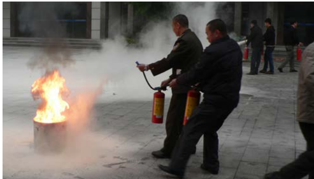
积极开展安全生产教育培训