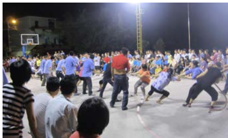
利华企业集团举办五一文体活动