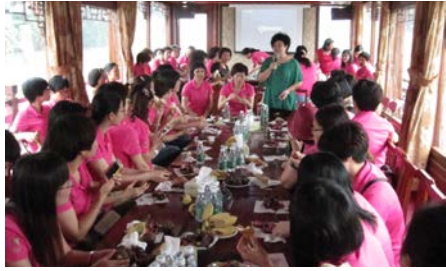
梦里水乡，智善之花美丽绽放