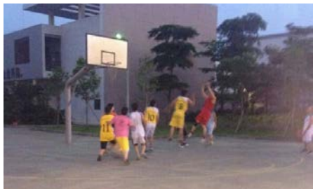
以球会友 携手互勉