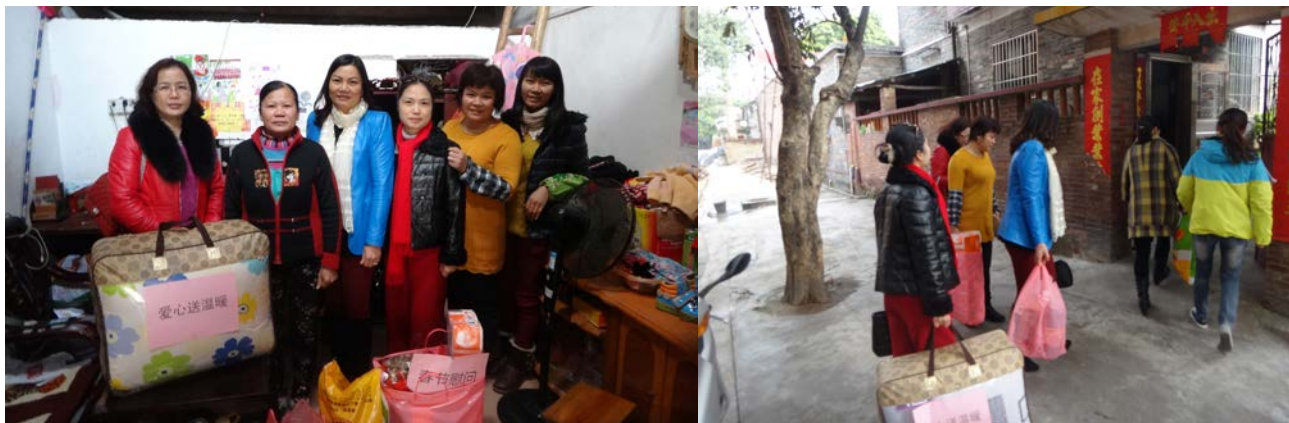
西樵女企业家商会开展“爱心送暖”慰问活动

为进一步改进对工会工作的领导，2014年3月，我镇工会召开了2015年西樵镇工会工作会议。进一步明确工会工作职责，切实明确主体责任，完善工作机制，部署2015年工作重点工作。