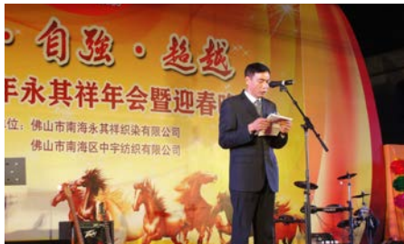
2014年永其祥“团结、自强、超越” 新春年会活动圆满结束