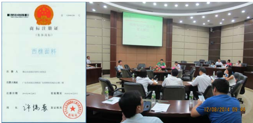
注册集体商标，助力产业发展

2014 全国纺织服装标准与质量管理论坛于 10 月 31 日在石狮隆重举行，国内外科研机构专家学者、国内大中小企业代表和品质管理专家代表 350 多人参加了会议。论坛围绕供应链的全面质量把控和管理，从行业动态分析、质量监督抽查、企业质量管理、服装安全性和舒适性、标准与检测存在的问题等方面展开深入讨论。论坛上，西樵纺织技术创新服务平台作为西樵纺织产业集群质量管理的代表机构，荣获“区域产品质量管理示范单位”称号。