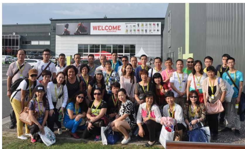
南海纺协组团参观法国面料展