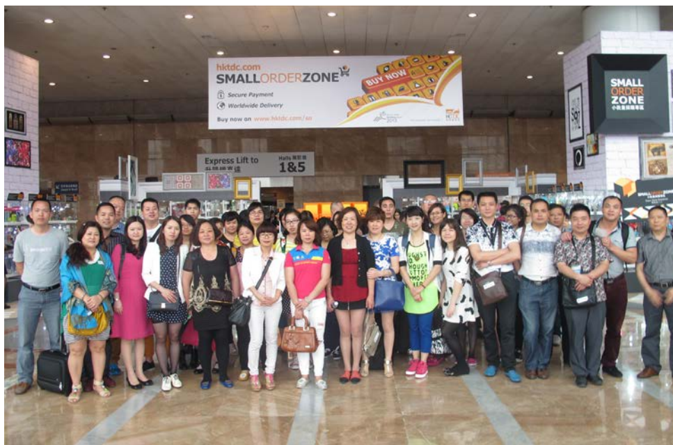
简讯 - 香港家纺展

2014年4月21日，南海纺织协会组织30家织造和家纺企业45人，参观了在香港会展中心举办的香港国际家用纺织品展和香港家庭用品展。