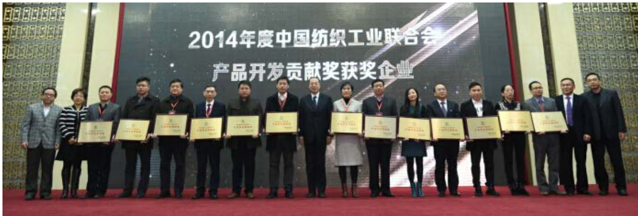
西樵 13 家纺企成为“全国示范”