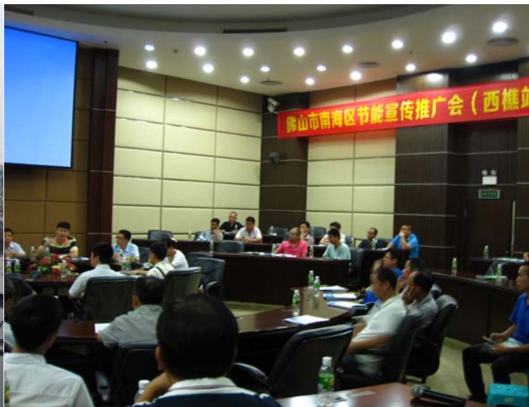
西樵开展节能宣传推广会