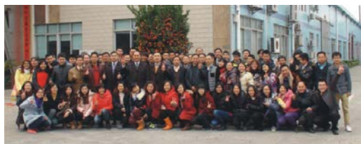
狮舞贺岁 开工大吉

式积极宣传个人技能晋升补贴政策，鼓励技工自我提升。本年度，共受理 79 人参加南海区专业技术人才职称认定评定申报。