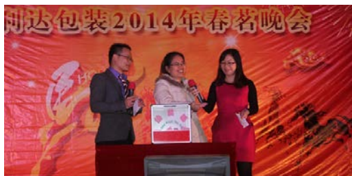
利达包装举行 2014 年春茗会