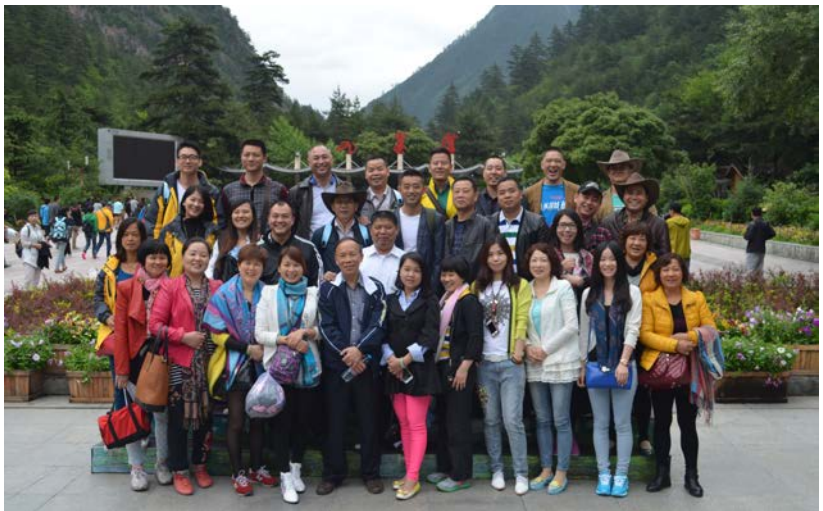
团队户外技能拓展