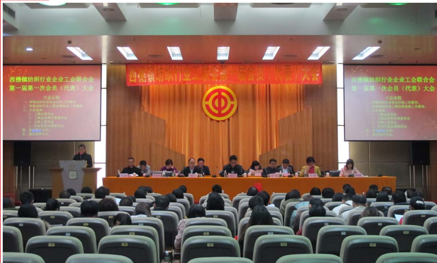
西樵镇纺织行业企业工会联合会成立大会