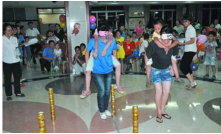
牵手过六一快乐共成长