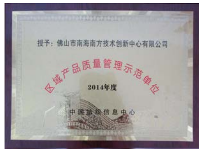
区域产品质量管理示范单位