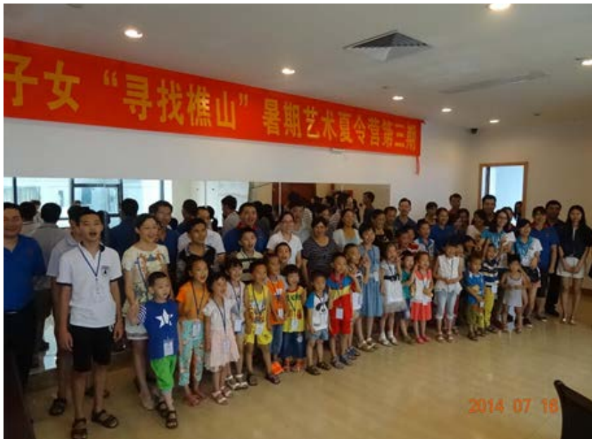
“寻找樵山”暑期艺术夏令营活动

优化财政支出结构，加大对教育、医疗卫生、安全等民生项目的投入。深化课程改革，推广素质教育，特色教育成为区域品牌，教育质量继续名列全区前茅。西樵中学新宿舍即将竣工，新增1200个宿位。