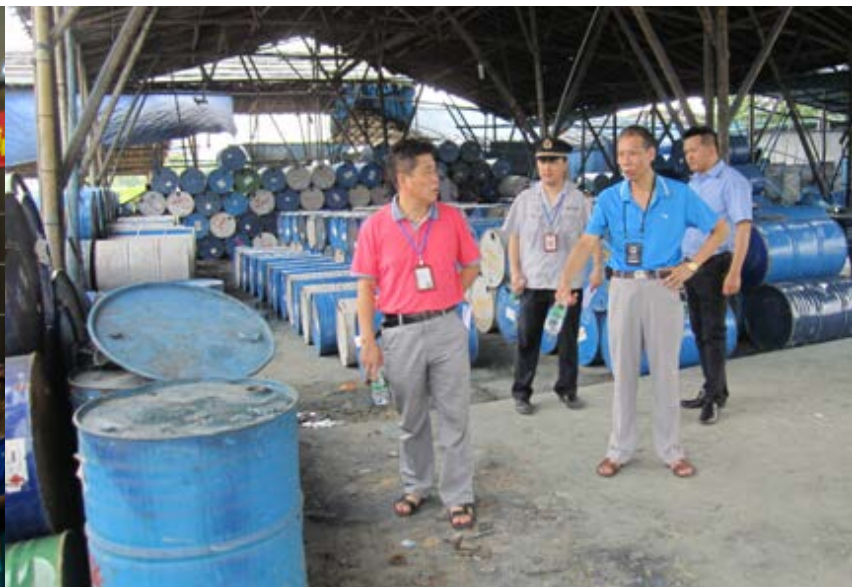
西樵专项行动整治清洗油桶厂