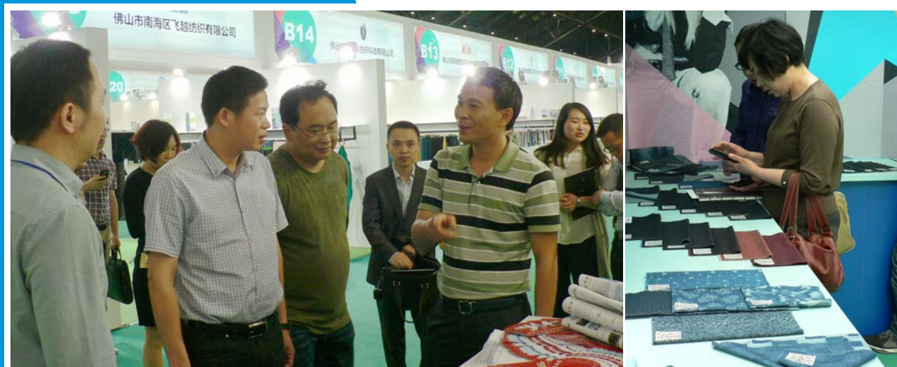
汇聚最新面料 展示最新时尚