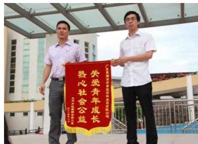
关爱青年成长，热心社会公益

第一小学获授牌为“国家级非物质文化遗产粤剧传习所”和联合国教科文组织“世界非物质文化遗产粤剧中国保护中心推广基地”。落实计生利益导向机制，持续推进计生全程优质服务，圆满完成上级下达的各项计生指标。