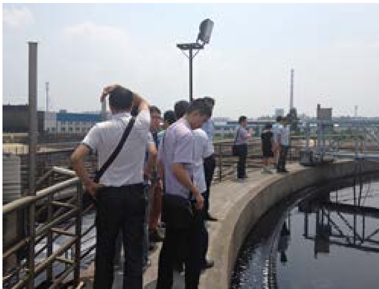
西樵出重拳治理臭气污染

开展西岸社区国家生态文明建设示范村规划。实施河南等7个村（居）的农村环境综合整治。完成筒村等3个