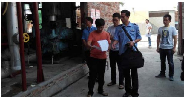
西樵镇联合多部门对涉氨制冷企业进行执法检查

2014 年积极开展全方位、多样式安全生产宣传活动。以安全月为龙头，全面开展我镇的安全生产的各项宣传，通过报刊、媒体、标语、短信等多种形式展开了各类宣传活动。