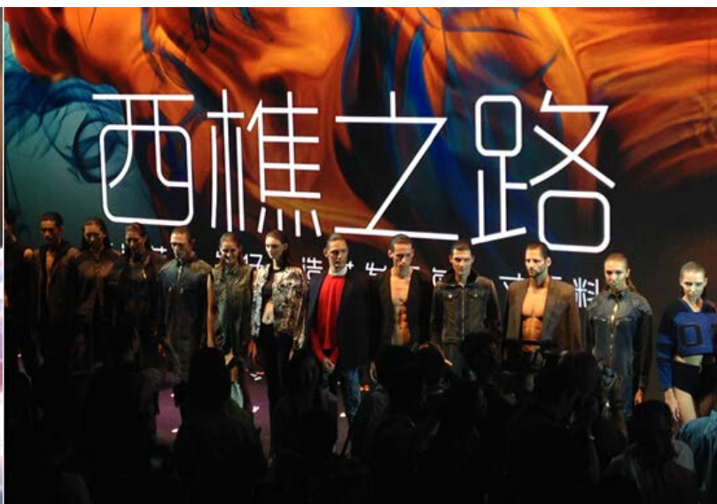
西樵面料”惊艳国际纺织博览会