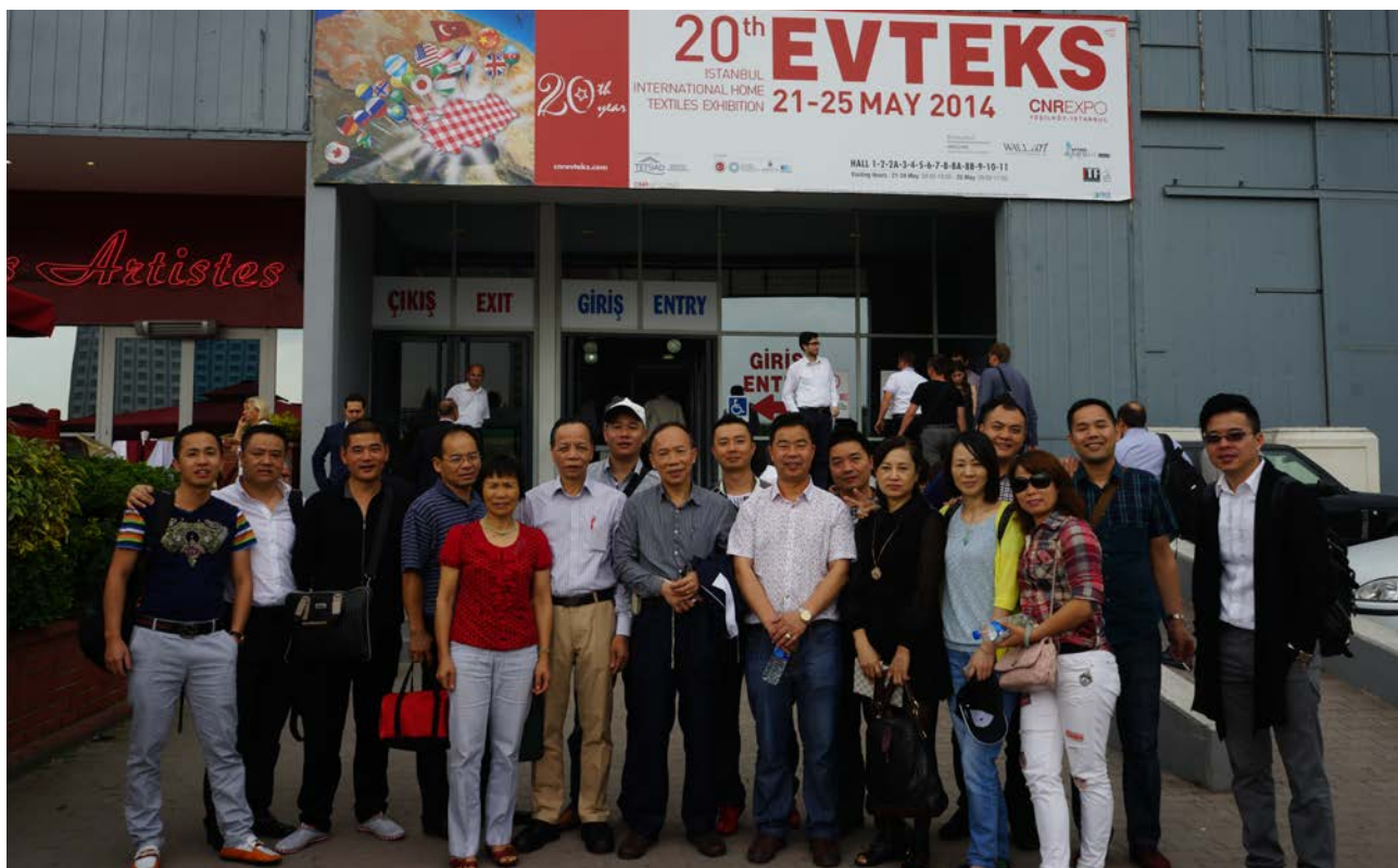
南海家纺协会组织企业到土耳其参加纺织品展览会