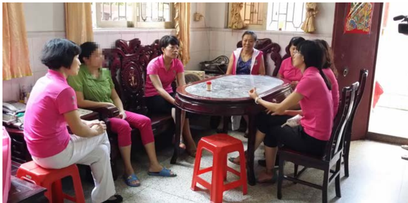
至善西樵 智善之爱