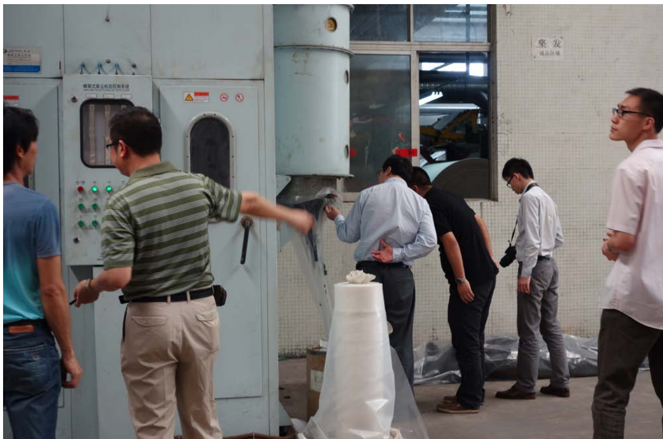
大唐印染冷堆工艺和蜂窝式除尘两项技术被评为广东省清洁生产优秀项目

2014年，处罚污染企业37家，关停污染企业46家，查处80台尾气超标机动车，淘汰1200多辆黄标车，完成大型锅炉降氮脱硝年度任务，刑事立案查处显岗9家违法油桶清洗窝点。“樵丹路—百太路—河岗大道—百业大道”划定为高污染限燃区，完成区域内39台燃煤锅炉的淘汰工作。建成崇北、平沙两个小型生活污水处理设施。完成樵北路、崇南黎涌等多项截污工程，新建污水管道约10公里。全年处理生活污水2000多万立方米，生活污水处理率达84.7%。纺织产业基地清洁生产工作有序开展，年减少排放二氧化硫7500多吨、化学需氧量（COD）5000多吨。纺织产业基地人工湿地生态系统改造提升顺利推进，入水终沉池系统工程通过专家评估论证。鑫龙污水处理厂二期工程计划2015年投入使用，污泥无害化、臭气治理及脱色工程正在实施。