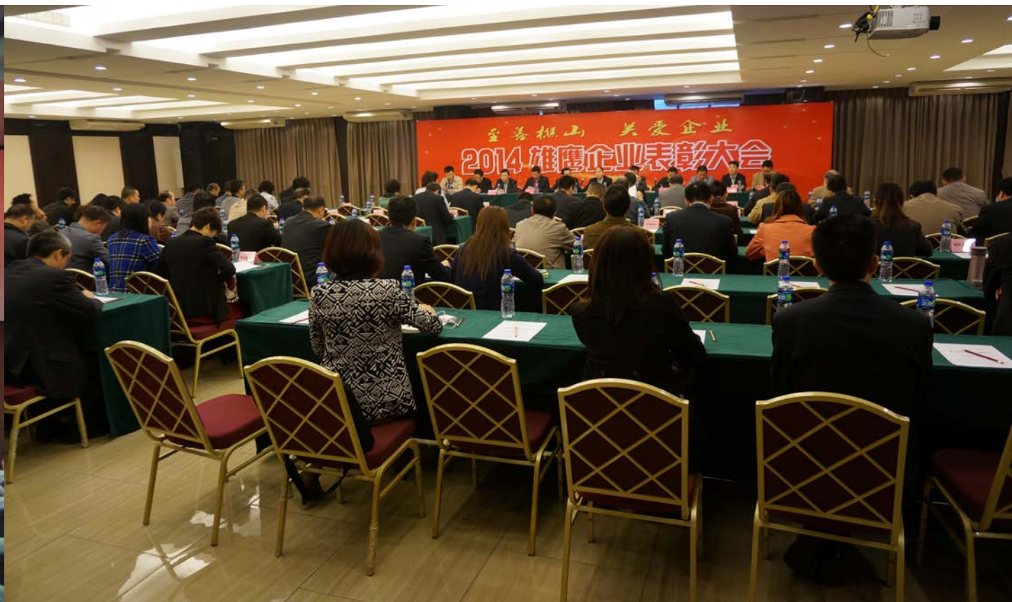
雄鹰企业表彰大会

在镇总工会的大力支持和精心指导下，经南海区纺织行业协会会长会议研究决定，成立西樵镇纺织行业企业工会联合会。2014年12月14日，南海区纺织行业协会在西樵创新中心多功能会议室召开“西樵镇纺织行业企业工会联合会”第一届第一次会员（代表）大会。