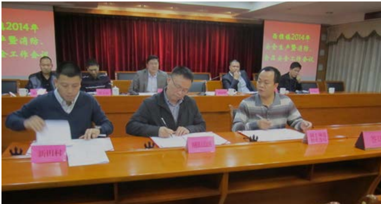
西樵镇召开 2014 年度第一季度安全生产工作会议

会制定《西樵镇 2014 年冶金等工贸企业有限空间作业与铝镁制品机加工企业安全专项治理工作方案》，负责“两项治理”专项行动的部署、指导和协调工作。本次专项整治行动中，经过统计共开展执法专项行动，出动检查人员 156 人、64 次、排查企业 29 家、排查发现隐患 19 条、督促完成整改隐患 19 条。从而构建了良好的企业生产秩序，确保了生产安全。