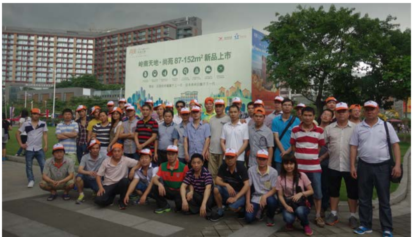
大唐优秀员工畅游美丽佛山